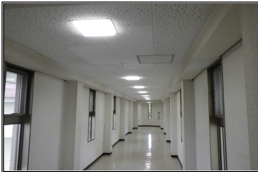
管理棟～工場棟3階 連絡渡り廊下