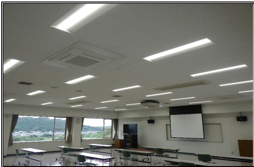
管理棟3階 大会議室